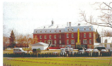
LE COUVENT DES SŒURS DU BON-PASTEUR

Le carré communal, cœur institutionnel, est le carrefour historique et géographique du lieu. Ceinturé par un sentier piétonnier, il sert aussi le rappel formel, dans le paysage, de la figure du Trait-Carré.