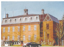
LE COLLÈGE DES FRÈRES MARISTES