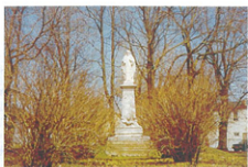
LE PARC DU SACRÉ-CŒUR