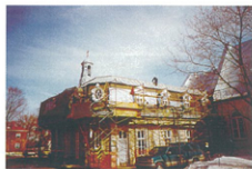
LA GRANDE SACRISTIE